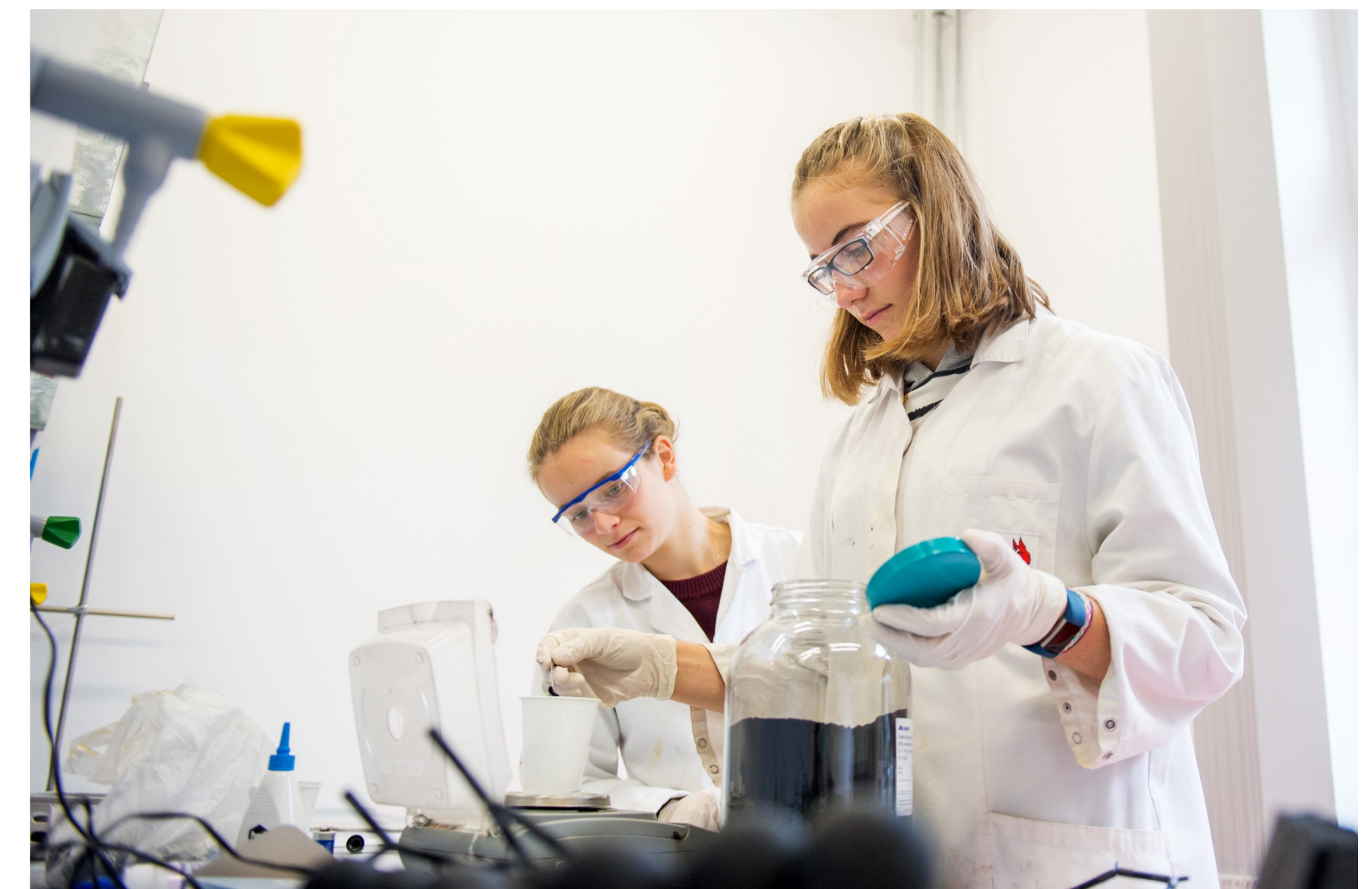
Learning to Teach-Lab: Science

www.profjl.uni-jena.de www.qualitaetsoffensive-lehrerbildung.de