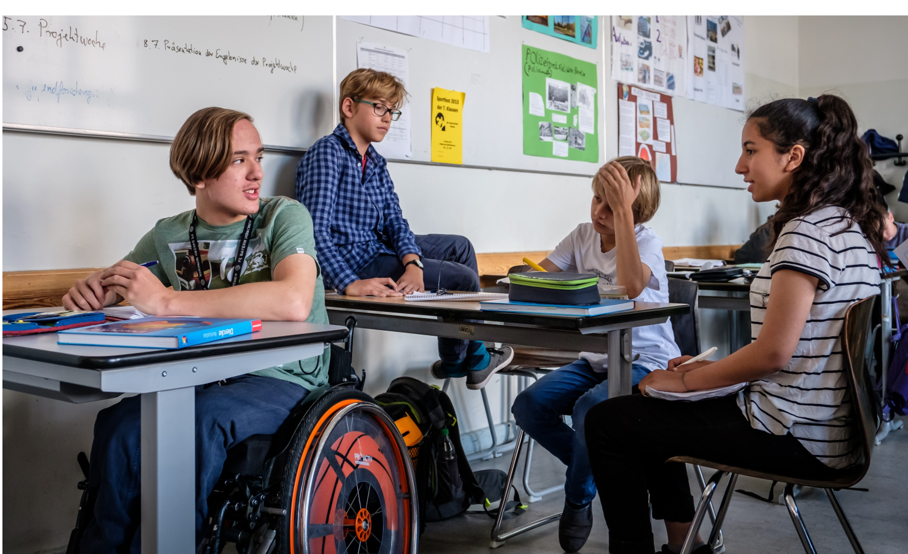
Inklusion systematisch implementieren