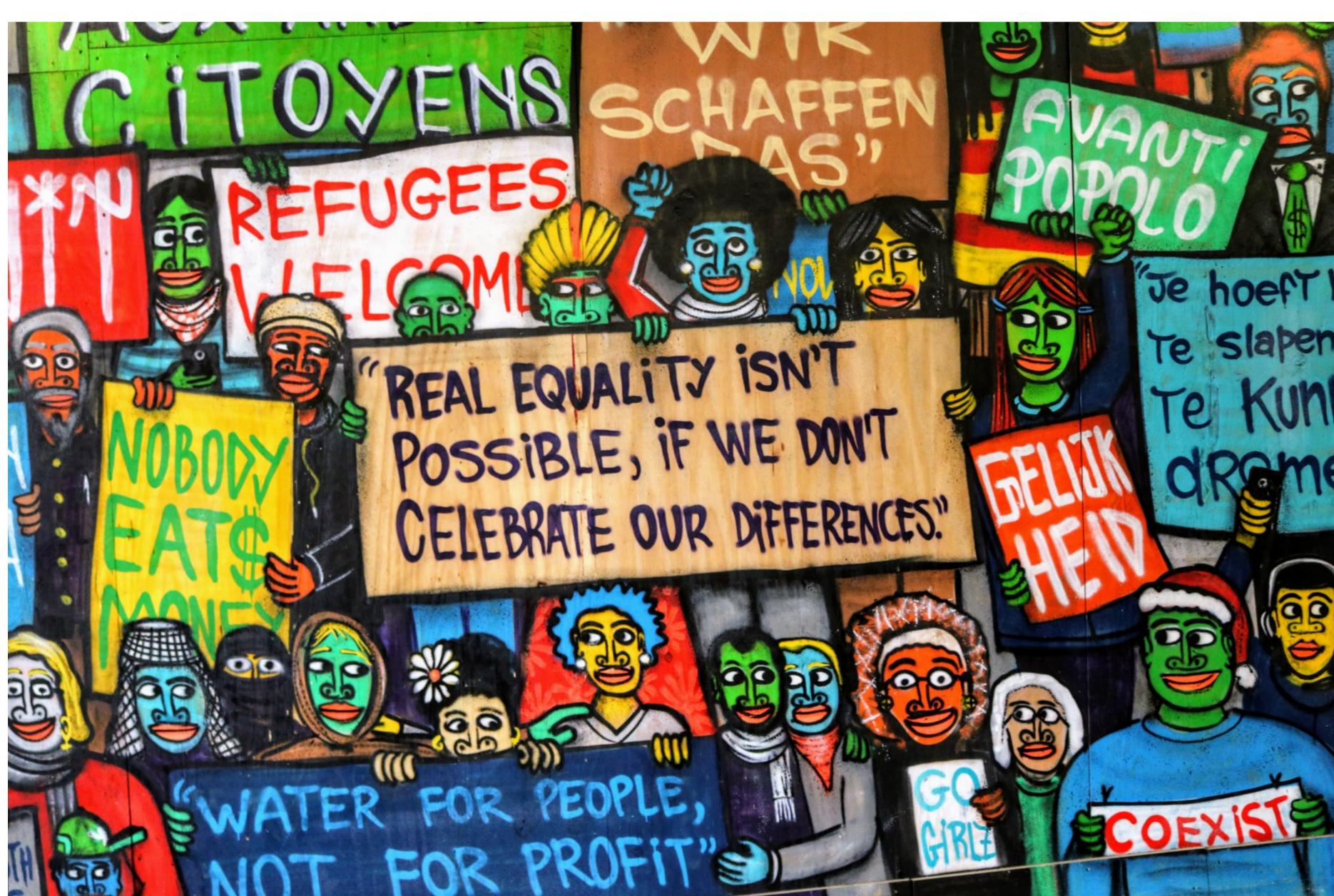
Lehrkräfte als Agenten der Demokratie