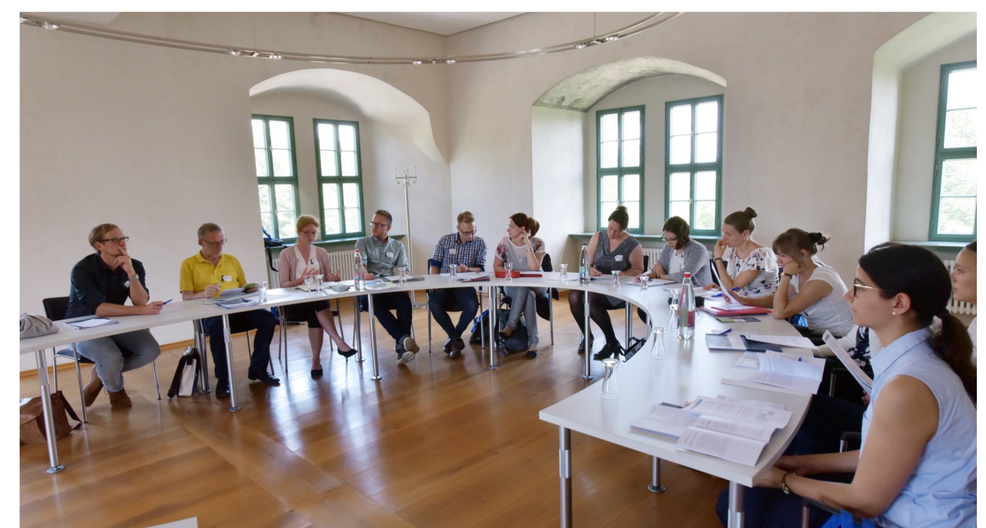
Forschungs- und Doktorandenkolleg Bildung, Forschung, Dialog .