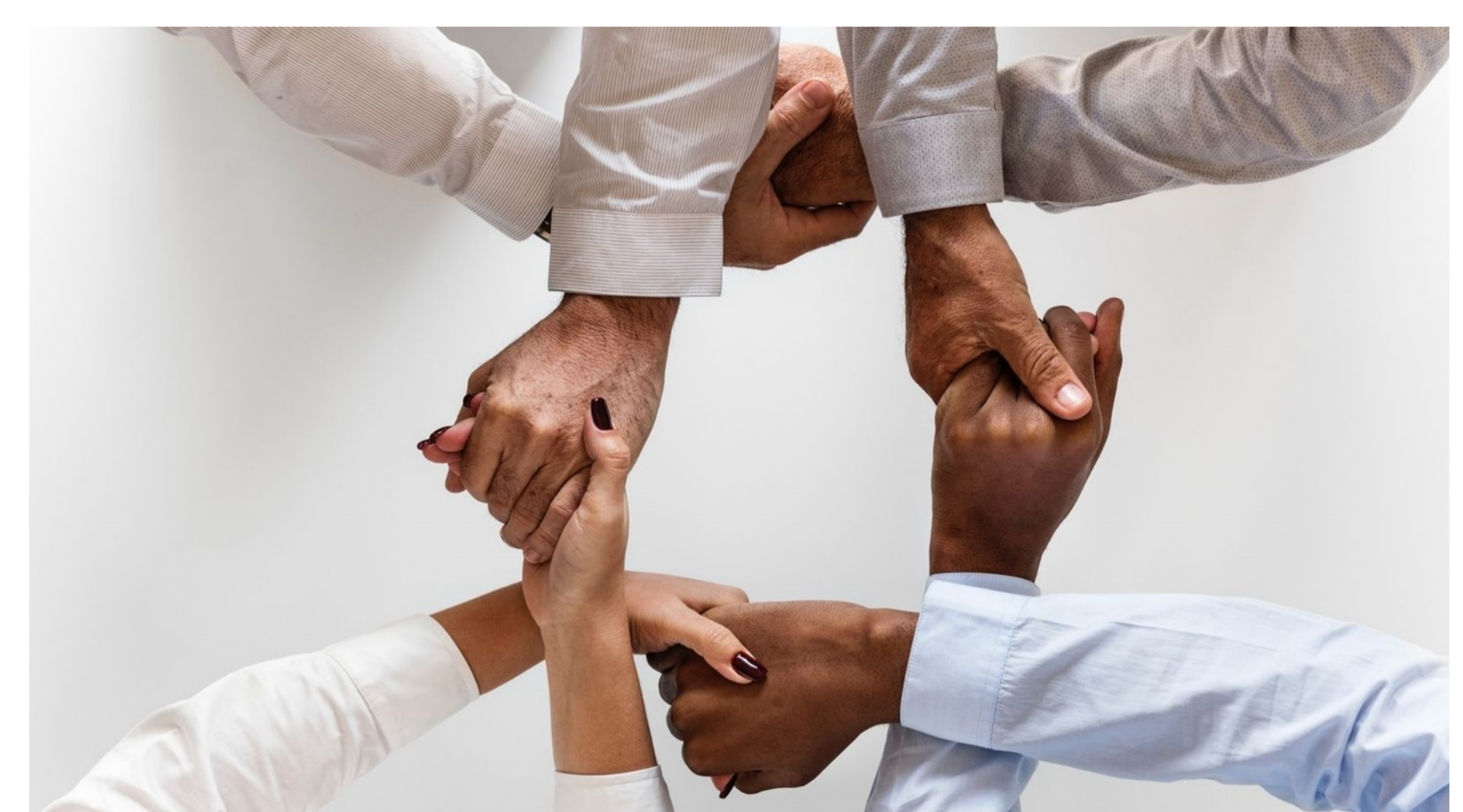
Ausbildung der Ausbilder